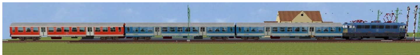
2. ábra. Kész van a V43-as külső nézete

Készen vagyunk mindennel, már nincs más tennivalónk, mint elindítani az openBVE-t majd vezetés közben külső nézetben megnézni, ahogy vonatunk kihúz egy állomásról.